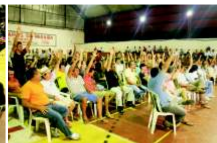
Assembléia dia 22/10

bancários foram às ruas em uma mobilização que fechou mais de 5.500 agências em todo o país. A enxurrada de interditos proibitórios e o pedido descabido de reforço policial da Tropa de Choque na porta dos bancos de João Pessoa não impediram a união da categoria. Nenhum artifício ou pressão conseguiu intimidar o movimento pacífico de quem, protegido pela Constituição Federal, quis defender os seus direitos. A unidade foi o poder de barganha para sensibilizar os empresários “na marra”, atingindo diretamente no bolso por essa atitude mesquinha dos banqueiros.