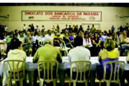
Assembléia dia 07/10

Em termos de unidade, os bancários saíram fortalecidos dessa campanha. A atuação dos bancários da rede pública foi decisiva para o fortalecimento da greve nos bancos privados, com destaque para a disposição de luta dos funcionários do BB, do BNB e com uma participação efetiva bem menor, dos novos