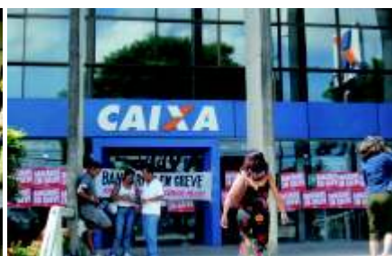
Greve na Caixa