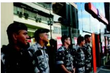
Repressão no Itaú

Lucius – Não. Ainda temos que trabalhar muito para conquistar avanços nas negociações específicas. Infelizmente, a mobilização e a unidade que conseguimos na Paraíba não aconteceram em todo o País, senão teríamos fechado um acordo melhor. Saímos de uma luta, mas outras continuam, como: debate sobre o assédio moral, lateralidade, Plano de Cargos e Salários (PCS), plano de funções. A mobilização continua, pois a luta da categoria é permanente e o Sindicato não pode se dar por satisfeito apenas por ter feito uma greve muito forte.