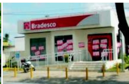
Grevenos Bancos Privados

Retrospectiva da greve_Quinze dias de greve, piquetes, assembléias e muita mobilização. Os bancários da rede pública e da rede privada de todo o Estado, com a liderança do Sindicato dos Bancários da Paraíba (Seeb-PB), realizaram uma das maiores paralisações dos últimos cinco anos. A união em busca de salários mais dignos e melhores condições de trabalho – resultando em mais de 90% das agências bancárias fechadas na Paraíba –, serviu de referência para todo o país. E provou, literalmente, toda a sua força contra a intransigência dos banqueiros em apresentar propostas, o papel tendencioso da Justiça