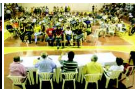
Assembléia dia 22/10