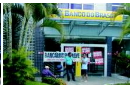
Greve no BB