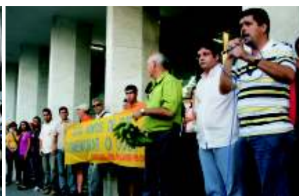
Protesto nos 200 anos do BB