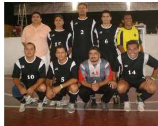
Equipe do Sindicato dos Bancários lidera segundo turno, após primeira rodada

Domingo, 18, não haverá jogos e as disputas no segundo turno voltam a acontecer no dia 25, com mais dois jogos: 09h45 Bradesco X Sindicato e 10h45 Banco do Brasil X Caixa.